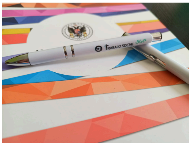
Imagen 2. Diseño de los bolígrafos serigrafiados.