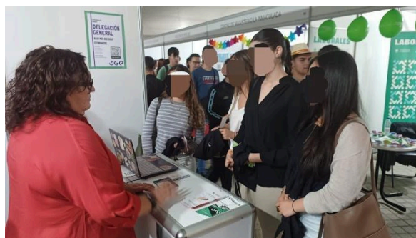
FIGURAS 1-12. Desarrollo de la actividad