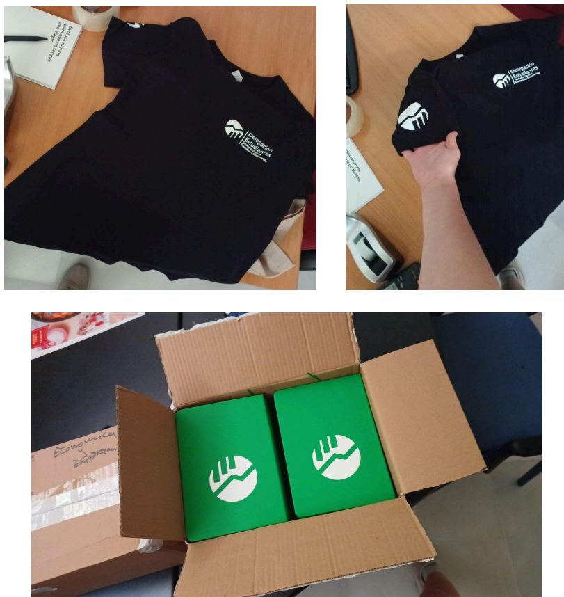
FIGURA 13-15. Material sufragado por la DGE