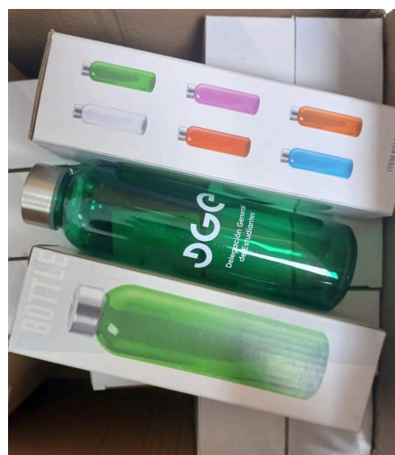
FIGURA 17-20. Material sufragado por la DGE con su logotipo respectivo