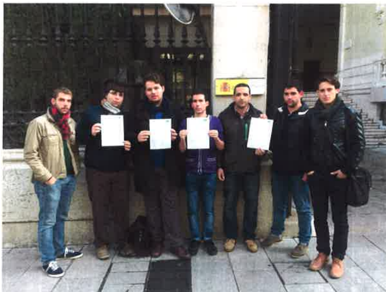
Delegados de 3 centros y miembros de la permanente en la puerta de la Subdelegación del Gobierno

urgencia al CEUNE para rendir cuentas de su política de movilidad Erasmus. Aunque tal convocatoria no llegó a celebrarse, el Ministerio procedió a la retirada de la medida propuesta. La acción fue cubierta por medios de repercusión provincial, regional y nacional.